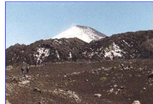
Vista desde el centro del valle hacia el NO. Se aprecia el frente de los glaciares, ubicado en este lugar en la cota 1.400 m.s.n.m. y a 8 Km. en línea recta del cráter del Villarrica.

Las paredes a ambos lados del valle exponen las diversas formaciones subvolcánicas.