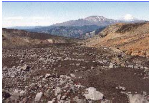
Vista desde el centro del valle hacia el SE. Al fondo se aprecian los volcanes, Quetrupillán y Lanín.

Las paredes a ambos lados del valle exponen las diversas formaciones subvolcánicas.