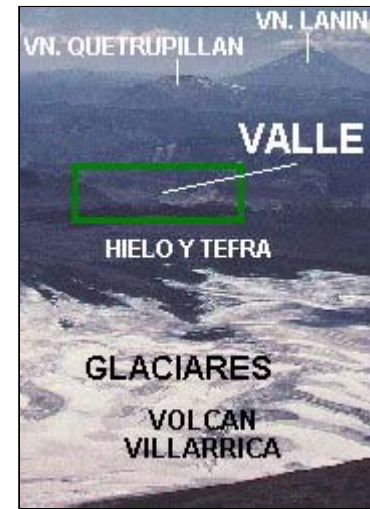
Vista desde la cima del Villarrica, hacia el SE.

La gran pared caldérica S-E del Villarrica, con forma de arco y paredes ligeramente inclinadas hacia el exterior, se encuentra interrumpida por un valle en forma de "U", orientado exactamente sobre el lineamiento tectónico regional que atraviesa los volcanes Villarrica, Quetrupillán y Lanín. Esta característica revela que el origen del valle es tectónico y se habría formado inicialmente por la lenta expansión de la corteza terrestre a lo largo de la falla. Posteriormente, la acción erosiva de los glaciares ensanchó y profundizó el valle, otorgándole la morfología actual.